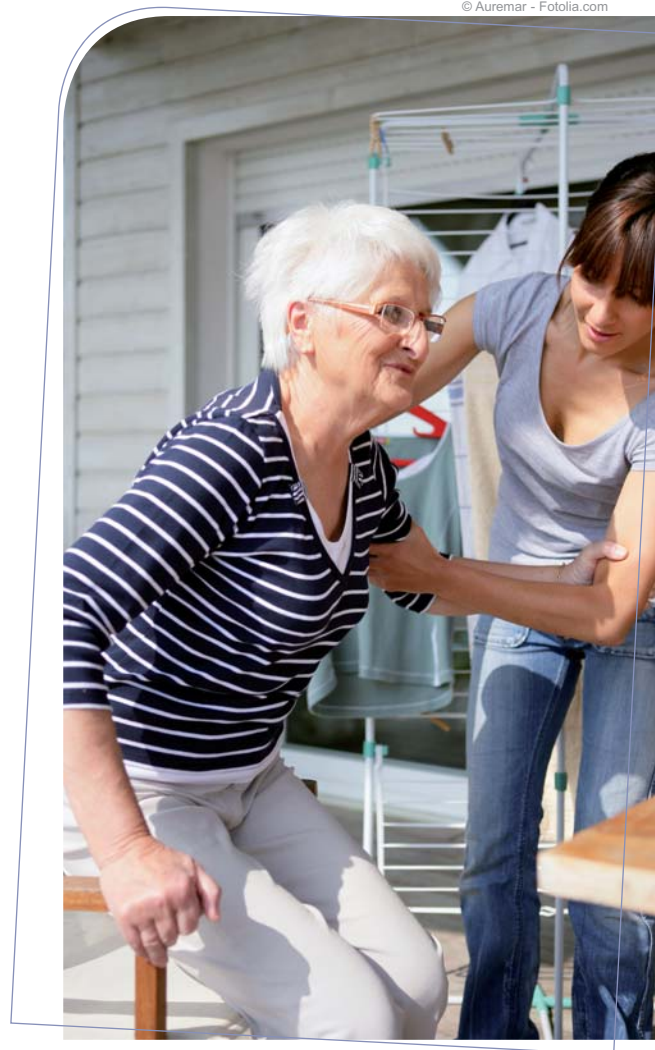
APA Allocation personnalisée d'autonomie