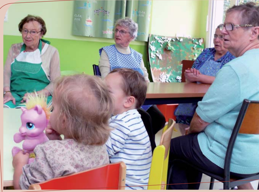
Action intergénérationnelle dans le Lunévillois.

Une multitude d'acteurs et de dispositifs viennent en aide aux personnes en perte d'autonomie. Afin de guider le public et les professionnels dans cet univers complexe, le service territorial PA-PH de Nancy et couronne a mis en place début 2011 une formation intitulée La perte d'autonomie, comprendre et orienter . Mise en place pour la durée du schéma gérontologique départemental, elle s'adresse aux acteurs du monde médical et médico-social, aux élus locaux, ainsi qu'aux agents des collectivités territoriales.